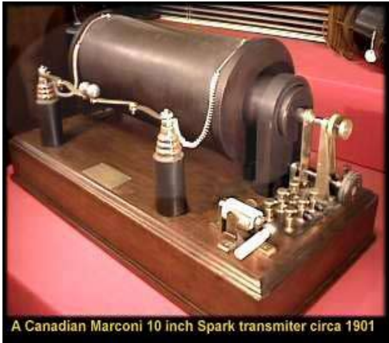
A Canadian Marconi 10 inch Spark transmitter circa 1901

جاریکیان له گه ل خانه واده که ی بوگه شت و خویشی روویانکرده زنجیره چیاکانی (ئه لپ) و له وی سه رگه رمی خویندنه وه ی بایه تیکی زانستی زانای ئه لمانی (هینریک هیرتز) بوو که (هیرتز) ده یسه لمینی ده کری شه پوله کاره باییه کان راسته وخو له هه وادا له شوینیکه وه ئاراسته ی شوینیکی تر بکرین، له م گه شته دا ته وای کاته کانی بوو بیرکردنه وه و پلاندانان بوو ئه م کاره ته رخانکرد، دوا ی گه رانه وه ی له گه شته که ی یه کسه ر سه ردانی ماموستا که ی (نا جو ستو ریخی) کرد که ماموستای فیزیوا بوو بیروکه که ی بوو باسکرد به لام ماموستا که ی ئه وه ی بوو باسکرد له وه ته ی (هیرتز) بوونی شه پوله کاره باییه کانی سه لماندوه زاناکان خه ریکی لیکولینه وه ن و نه یاننوانیوه هیچ بکن